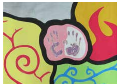
„Živly“ malba temperovými barvami

Malba byla součástí niterného mapování, hledání vlastní autenticity, pravdivosti, identity, při vyrovnávání se zklamáním v pokusech o falešné řešení citových konfliktů cestou zneužívání drog.