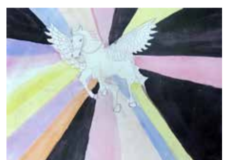
„Naděje“ kolorovaná kresba

Kresba byla cestou sdílení citového prožívání v náročné životní situaci.