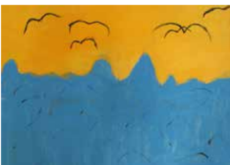
„Vzpomínky“ malba temperovými barvami

Setkání skupiny 3 autorů se svým vnitřním světem ve společné malbě. Setkání pro inspiraci, sdílení, lepší pochopení druhých i sebe sama.