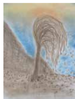
„Stesk“ kresba pastelem

Barvami popsal autor, hledající porozumění svým okolím i sám sobě, své niterné prožívání zdrojů útěchy a životní energie, i frustrujících a zatěžujících životních okolností.