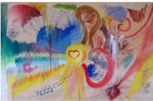
„Přátelství“ malba temperovými barvami

Čtyři živly zastupují čtyři stránky, zdroje a strategie vyrovnávání se s těžkou traumatickou zkušeností a tíživou životní situací, které lze v odstupu nahlédnout.