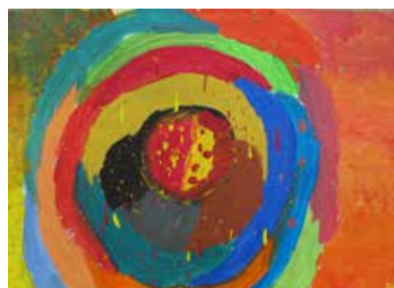
„Studna srdce“ malba temperovými barvami

Motiv ze vzpomínek na šťastné chvíle dětství stráveného na jihu Evropy, které přinášely posilu v nalézání rovnováhy v pozdějším psychicky náročném období.