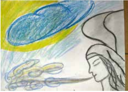
„Anděl síly“ kresba pastelem