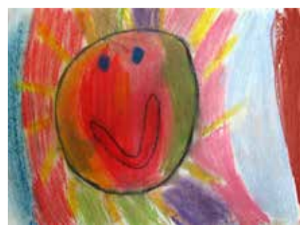
„Nevzdám to“ kresba pastelem

Poselstvím kresby, která vznikla jako bilance životních omylů je: náš čas je vyměřený, jako dveře se před námi otevírají cesty, lákavé, dobré, těžké i nebezpečné.