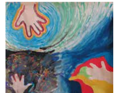
„Setkání“ malba temperovými barvami

Obrázek nebyl bezstarostným sluníčkem, ale bojem otevřenosti životu s bolestí z tragické ztráty nejbližšího životního vztahu, snahou zvládnout lítost a stesk.