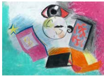
„Cesty“ kresba pastelem

Společná malba skupiny, kde autoři sdíleli vzájemnou podporu zvládnání těžkého životního období